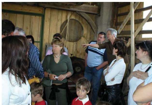
Gostje v muzeju na Griču.