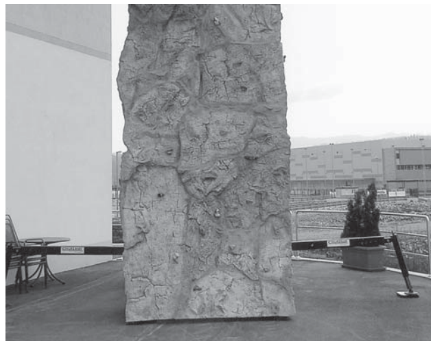
Umetelna plezalna gmota.

Ob Gostinsko rekreacijskem centru Zapolje se nam ponuja ogromna skulptura nenavadnih oblik. Kajpak, ne gre za spomenik, pač pa za gibljivi plezalni stolp (Spider Rock). Ta je primeren za plezalne poskuse začetnikov, na njem pa se lahko preizkusijo tudi vrhunski plezalci.