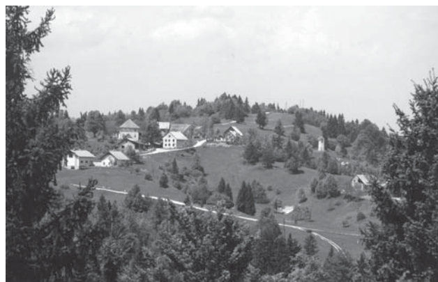
V jedru Žibrš.