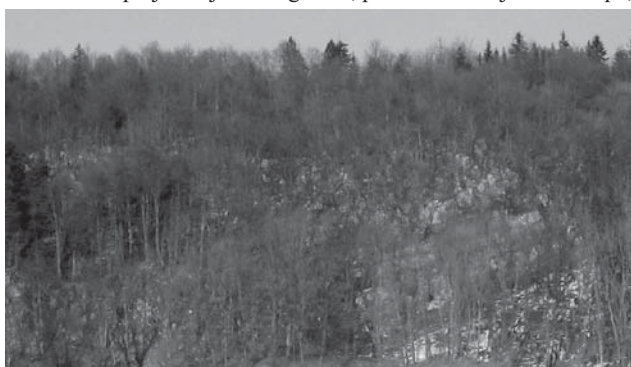
Te nesrečne stene!

Pa še besedo, dve o Evropskem muzeju krasa (EMK) v tem okolju. Pohvale gospodu Lojzetu Peterletu, da je kot možno lokacijo EMK izbral Slovenijo in tako bi v Slovenijo prišel zajeten kup »evropskega« denarja. Predvsem sem pa vesel, da se o Planinskem polju zdaj veliko govori, piše in razmišlja. Mislim pa,