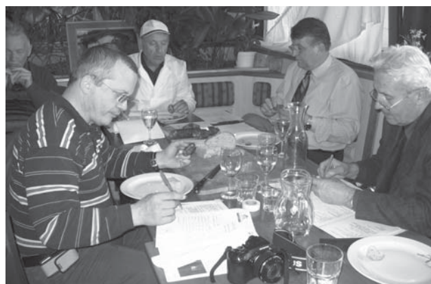
Komisija je ocenjevala nepopustljivo natančno.

Higiena. Posebno pozornost je treba nameniti ovitkom, ki morajo biti dobro očiščeni. Mnogo več pozornosti moramo