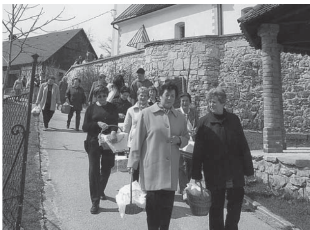
Velikonočni "žegen" se vrača od sv. Jožefa.

Velika sobota je eden tistih prazničnih dni med velikonočnimi prazniki, ko se blagoslovljajo ogenj, voda in velikonočne jedi – že od davnine »žegen«.