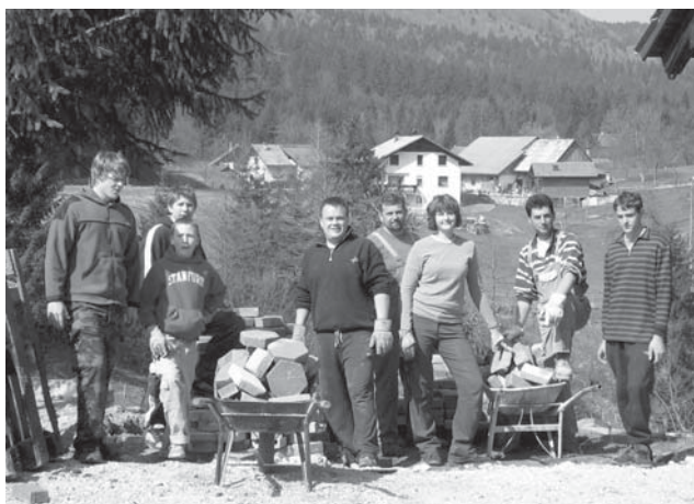
Manjkajo le sekači.