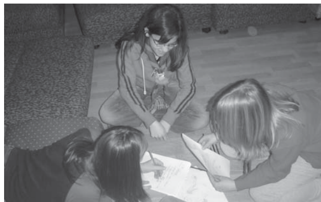
Ko skavtinje narčtujejo.