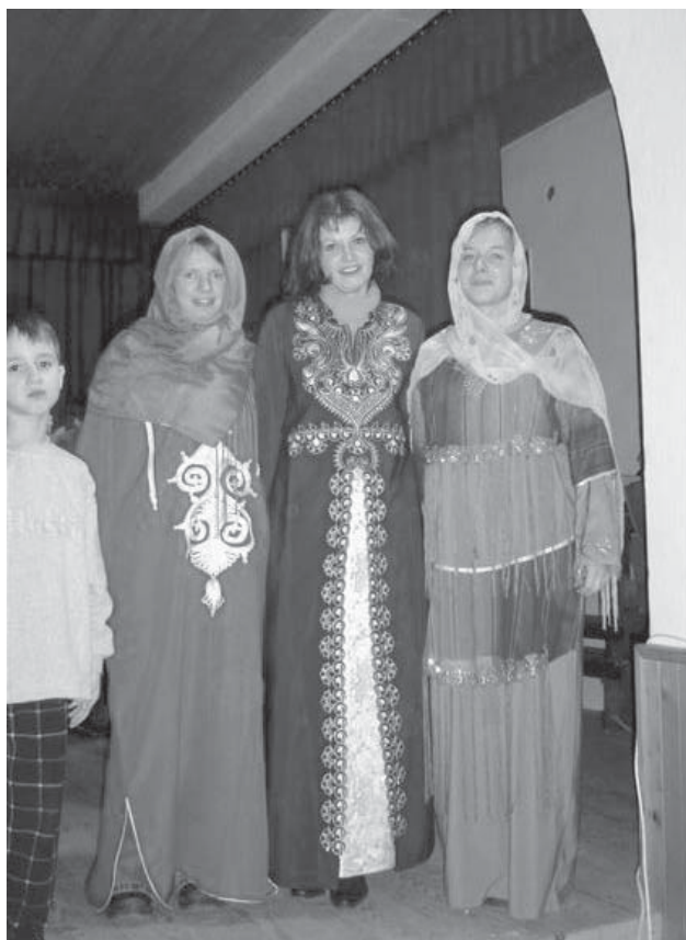
Skoraj čisto prave Tunizijke.

Zato smo se na podružnični šoli v Rovtarskih Žibršah še sredi mrzle zime začeli pripravljati na ta praznik. Pripravili smo igrice Melite Osojnik Pravljica o zlati roži. Dodali smo ji še glasbo in nastala je prava pravcata glasbena pravljica. Ko je zunaj še naletaval sneg, so v naši učilnici cvetele rože, mi pa smo spremljali dečka, ki je iskal zlato rožo, da bi si kupil srečo. A sreča ni zlata roža, sreča je v dobrem, ki ga storimo, v veselju, ki ga širimo krog sebe, v nasmehu in prijateljstvih.