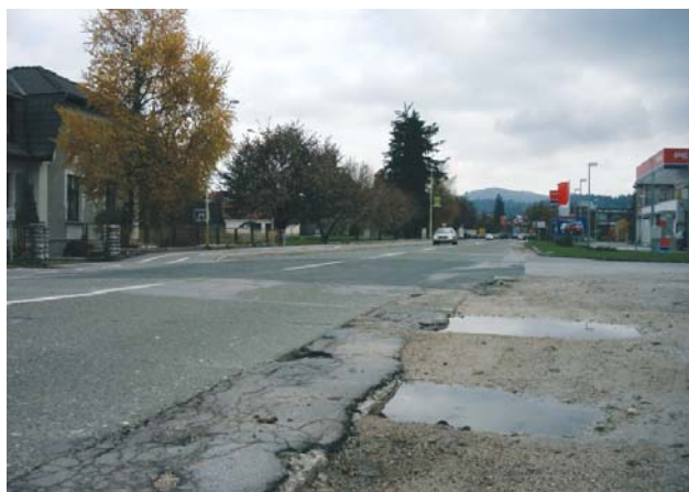
Ta podoba Trzárške ceste bo kmalu šla v pozabo.

V razpisnem roku so prispele tri ponudbe za izvedbo rekonstrukcijskih del na magistralki od križišča pri Klamu do križišča pri Kramarju. Okvirno investicijsko vrednost 360 milijonov bo financiralo Ministrstvo za promet s skoraj tretjinskimi sofinanciranjem naše občine. Če ne bo hujših zapletov pri izbiri najugodnejšega ponudnika, se bodo dela začela konec letošnjega maja.