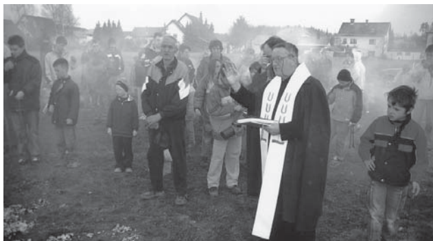
In gospod Janez je takole blagoslovil velikonočni ogenj.

Stara navada je, da so na velikonočno soboto gospodinje zakurile peči ali štedilnike z blagoslovljeno žerjavico, ki so jo ponekod raznašali cerkovniki, ministrantje ali pa kar vaški otročaji. Ti so za nagrado prejeli kako jabolko, pomarančo, ponekod pol klobase ali celo nekaj drobiža.