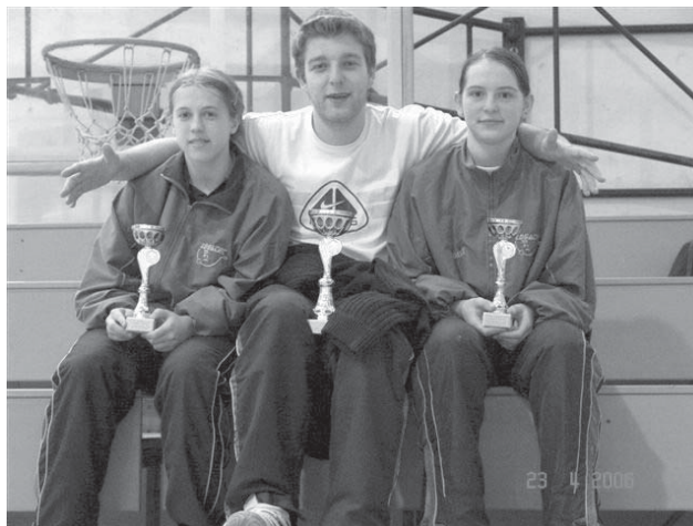
Med obetavnimi kadeti.

Na Ptuju je bilo od 22. do 23. aprila državno kadetsko prvenstvo, ki se ga je udeležilo 142 kadetov in kadetinj. Skoz dvodnevno tekmovanje so se pomerili posamezno, v dvojicah in mešanih dvojicah. Iz logaškega Namiznoteniškega kluba se je prvenstva udeležilo devet igralcev in igralk, ki so na napornem tekmovanju dosegli vrhunske rezultate.