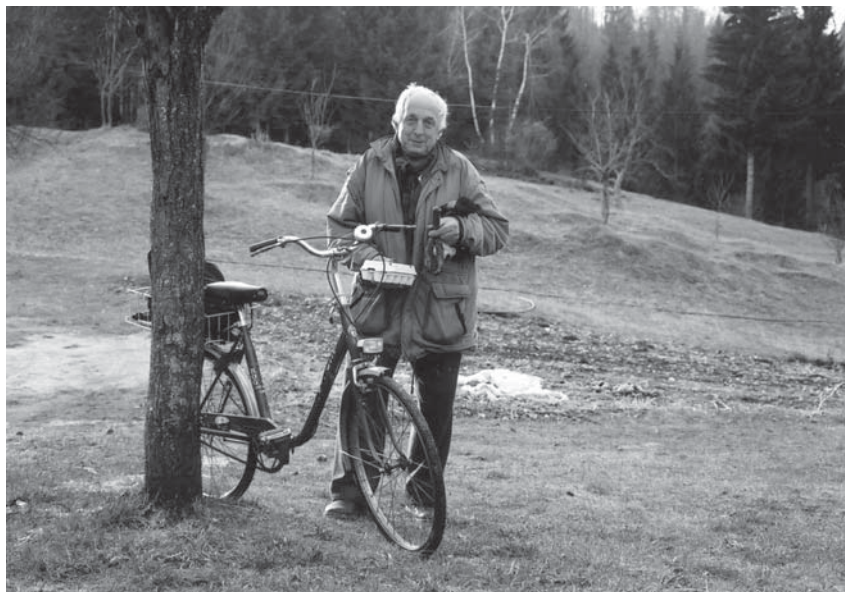
Vinko, jajca pa tak bicikl.