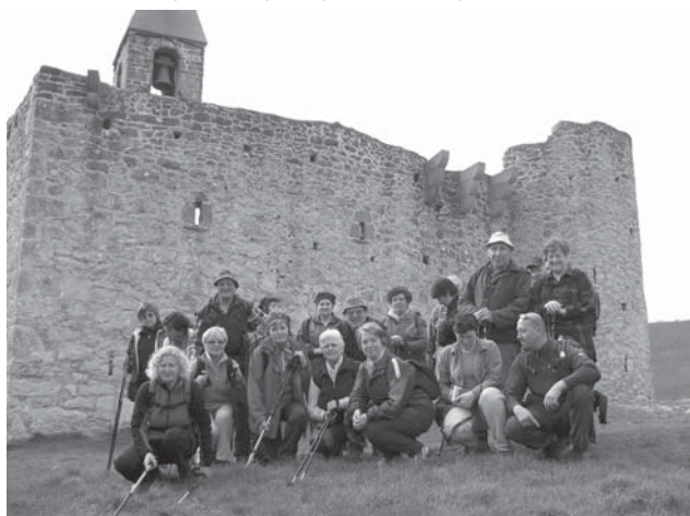
Pred starosvetnim taborom.