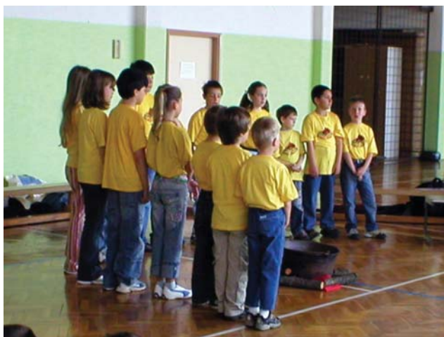
Zapeli so otroci iz repentaborske šole.