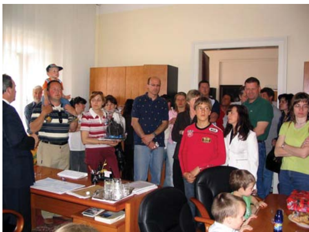
Župan je sprejel goste tudi v občinskih prostorih.

Učenci osnovne šole Repentabor so se v družbi knjižničarke Špele sprehodili skozi Logatec do Knjižnice, kjer so jih čakale knjižne police in članice DPOM s programom delavnic.