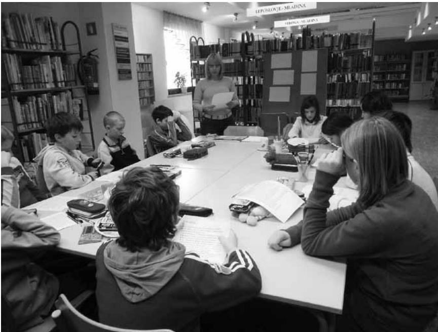
V risanju ilustracij so se preskusili tudi učenci iz Rovt.

Razstava ilustracij in likovne delavnice Adriana Janežiča