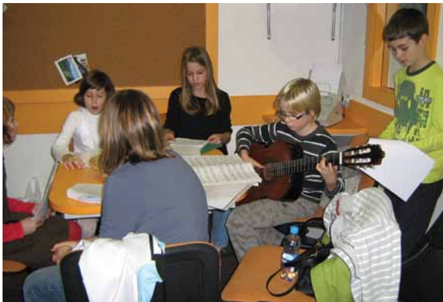
Zvočni zapis za slikanico so učenci posneli na Radiu 94 in NTR.