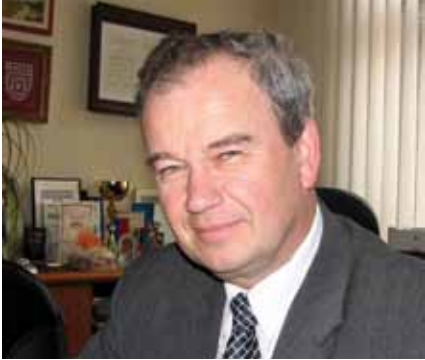
Župan Janez Nagode

Zapleten postopek pridobivanja kohezijskih sredstev – Ministrstvo spet spremenilo pogoje za pridobitev sredstev za gradnjo čistilne naprave in kanalizacije