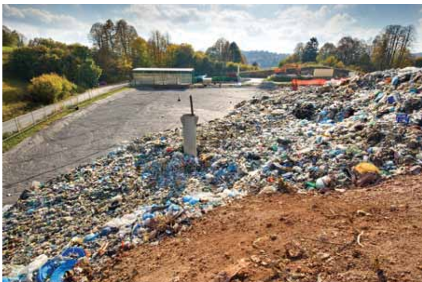
Odlagališče na Ostrem vrhu bo po letu 2012 treba zapreti.

Odpadke bomo obdelovali mehansko (sortiranje), s čimer bomo dobili ločene frakcije: plastiko, kovine in barvne kovine, papir in karton, lahko frakcijo odpadkov kot RDE, primerno za sosežig, biološke odpadke in ostanek odpadkov. Biološki odpadki se obdelajo v posebnem, anaerobnem postopku fermentacije, pri čemer nastanejo bioplina, ki se uporablja za pridelavo električne energije, toplota, ki se uporablja v samem tehnološkem procesu, in surovi kompost, ki se lahko uporablja