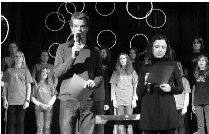
Zbor se je predstavil tako s slovenskimi ljudski pesmimi in popevkami kot z eksotičnimi zborovski skladbami.