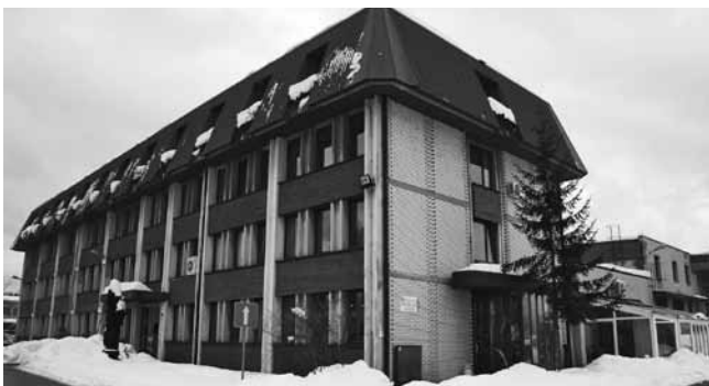
Objekti in zemljišča nekdanjega logaškega lesnopredelovalnega obrata so na voljo po 120 evrov za kvadratni meter.

N a sedežu družbe Kli Logatec v likvidaciji je bila 22. decembra 14. skupščina delničarjev, na dnevnem redu sta bila predvsem pomembna poročilo o poteku likvidacije podjetja ter prevzem arhiva družbe. Likvidacija se približuje koncu, še vedno pa teče postopek o dokončni odprodaji stanovanj, dokončni izterjavi terjatev (opomini, tožbe, izvršbe ter odprodaja naložb in delnic Triglava) in še nekatere druge zadeve.