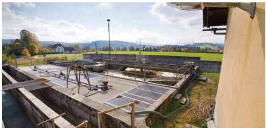
Novo čistilno napravo v Dolnjem Logatcu naj bi postavili s pomočjo evropskih sredstev.