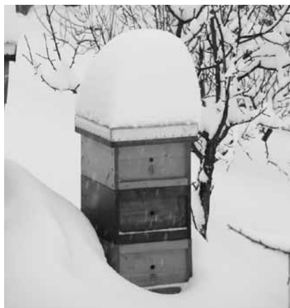
Sneg je prekril čebelje panje.

Zadnje novembrske dni pa smo logaški čebelarji izkoristili za sajenje lip, akcija sta na državni ravni organizirala ČZS in Zavod za gozdove Slovenije. Na območju logaške občine smo zasadili več kot 70 lip. Tisti, ki se sprehajajo okoli Sekirice, bodo spomladi lahko v Rakovniku opazili celo manjši drevored, ki bo čez nekaj let dajal senco utrujenim sprehajalcem, čebelam pa obilno lipovo pašo.