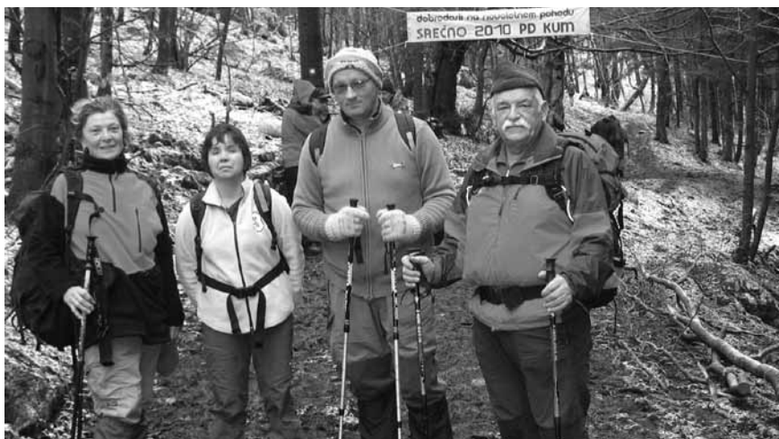
Še preden so se planinci peš podali v Dražgoše, so se 2. januarja tradicionalno udeležili pohoda na 1220 metrov visoki Kum. Letos so bili med pohodniki le štirje logaški planinci.

Kolona pohodnikov, opremljenih s pohodniško opremo in prižganimi čelnimi svetilkami, je šla s Pasje ravni (850 m), skozi vas Sv. Petra hrib in po dveh urah zahtevne hoje prišla v nižje ležeči Zminec v Poljanski dolini (380 m), kjer smo dobili topel čaj. Pohod smo kmalu nadalje-